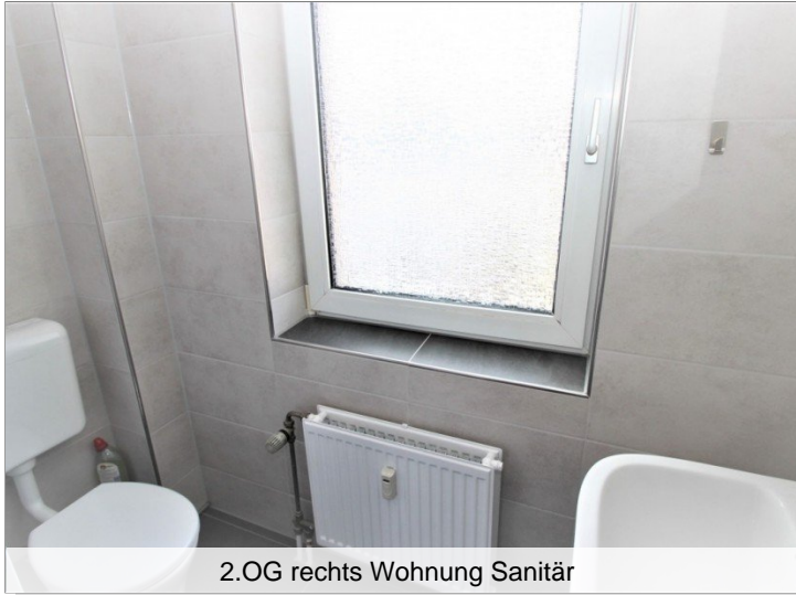
2.OG rechts Wohnung Sanitär