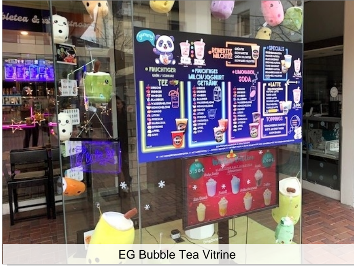
EG Bubble Tea Vitrine