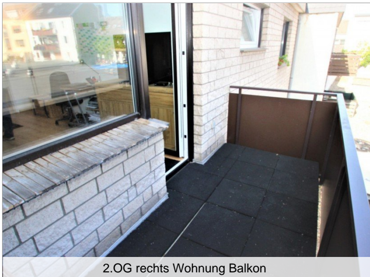
2.OG rechts Wohnung Balkon