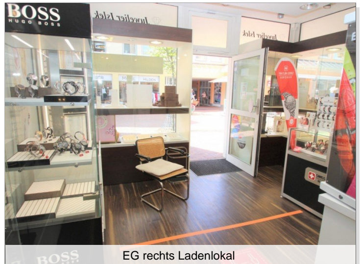
EG rechts Ladenlokal