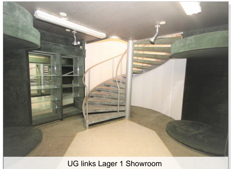
UG links Lager 1 Showroom