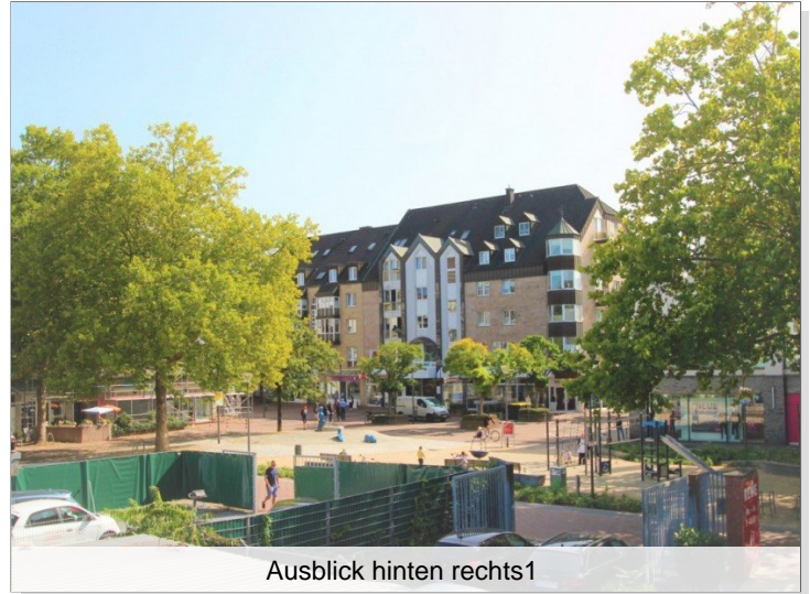
Ausblick hinten rechts1