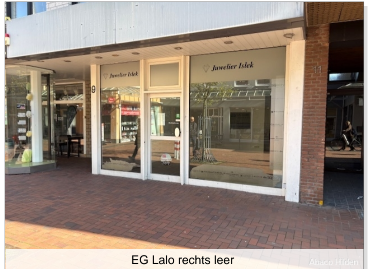
EG Lalo rechts leer