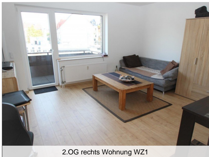
2.OG rechts Wohnung WZ1