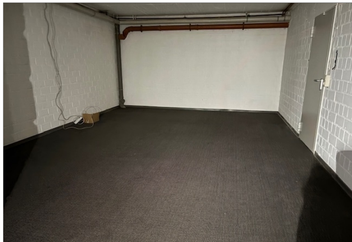
UG Lalo rechts Lagerraum gross